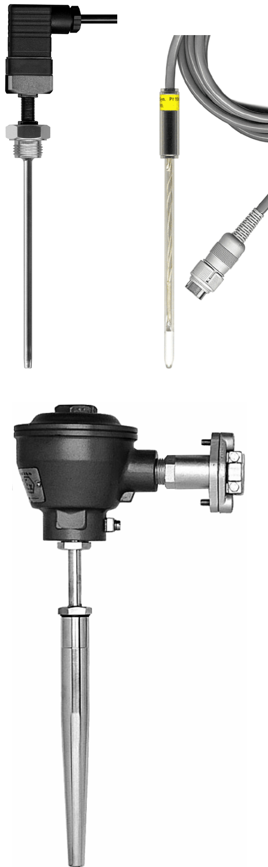
Slika 4. Sonde sa sensorom Pt 100: industrijska i laboratorijska ( Symmetry, RS ) i sonda sa protiveksplozivnom zaštitom ( Jumo, D ).